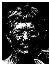
af Hanne Macsaj

En svejtsisk forsker blev grebet af emnet.